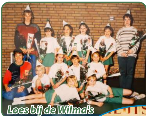
Loes bij de Wilma's

waar ik naar uit keek. Bij de sportclubs in Wilbertoord heb ik bij de majorettes van Topido gezeten, een aantal jaar korfbald bij “de Wilma’s” en getennist bij TVW ‘84.