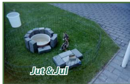
Jut & Jul

Wat ik ook altijd fijn heb gevonden zijn alle dieren die we thuis en/of bij onze moestuin hebben gehad. We hadden bij de moestuin